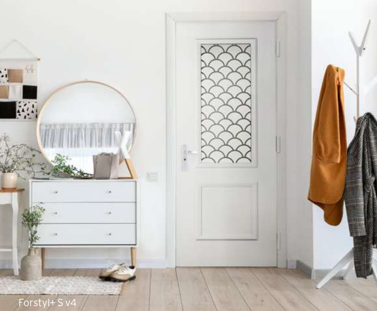
Forstyl+ S v4