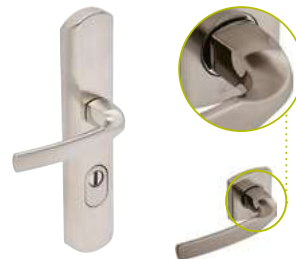
Aileron & Béquille sur plaque