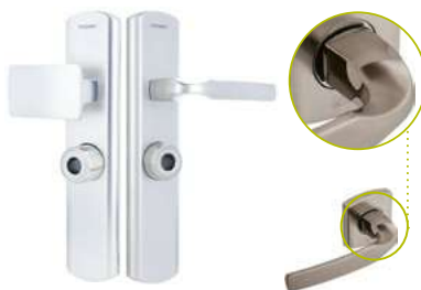
Aileron & Béquille sur plaque