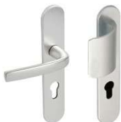
Aileron & Béquille sur plaque