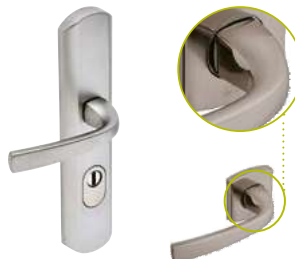
Aileron & Béquille sur plaque