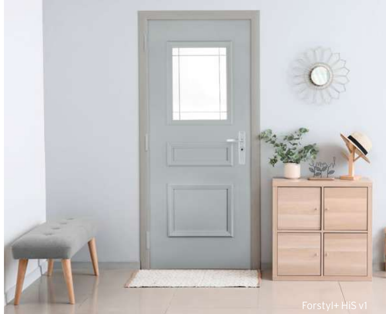
Forstyl+ HiS v1