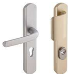
Aileron & Béquille sur plaque