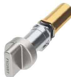
Cylindre 787M à bouton Cylindre 787M débrayable