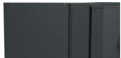
FINITION RIVETÉE SPÉCIALE « ACIER GALVANISÉ ANTI-ROUILLE »